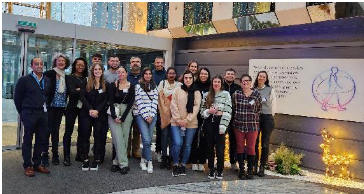
Visite chez Medtronic à Tolochnaz