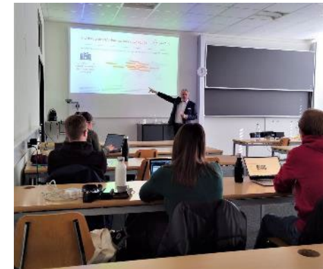
Présentation du case study, Lancement d'un nouveau dispositif médical de diagnostic rapide

Toutes les études de cas sont apportées par des professionnels du secteur