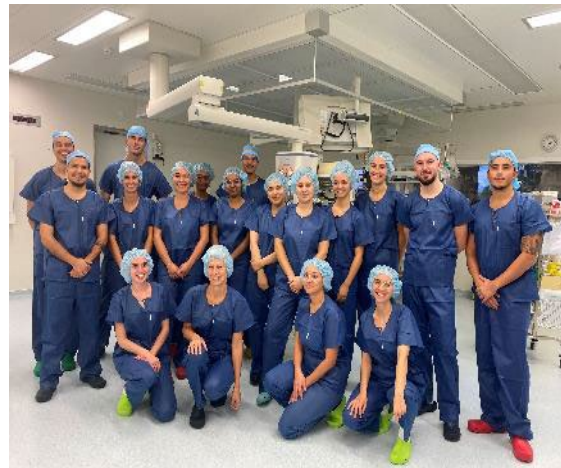
Visite aux Etablissements hospitaliers du nord vaudois (eHnv) à Yverdon-les-Bains