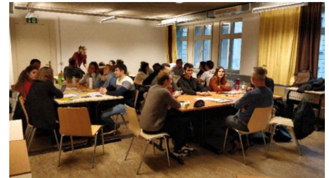
Ateliers d'échange avec des employeurs potentiels