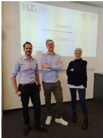
Intervention des HUG, Atelier flux

Cours théoriques , pour vous forger des connaissances générales sur le système de santé en Suisse, orienté prestations de soins, ..... avec de nombreuses interventions de professionnels du secteur... et une visite immersive , directement sur le terrain !