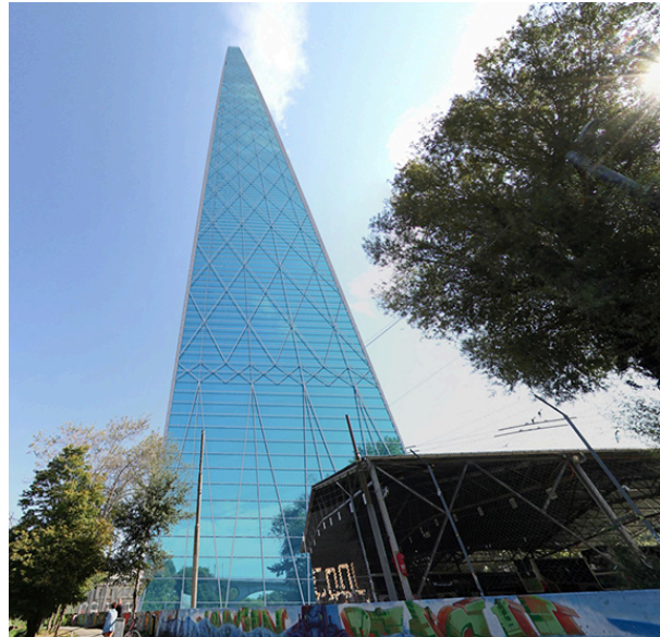
La plus haute tour du monde construite virtuellement à la Jonction.

L'application mobile REGARDS – EVENEMENT HES propose une balade virtuelle à travers tout le territoire du Grand Genève. On voit ainsi surgir sur l'écran de son smartphone la plus haute tour du monde érigée à la Jonction, une heure de trafic sur le pont du Mont-Blanc empilée sur l'île Rousseau, ou encore le lac Léman retrouvant la place qu'il occupait avant les travaux de remblaiement des quais de Thonon-les-Bains.