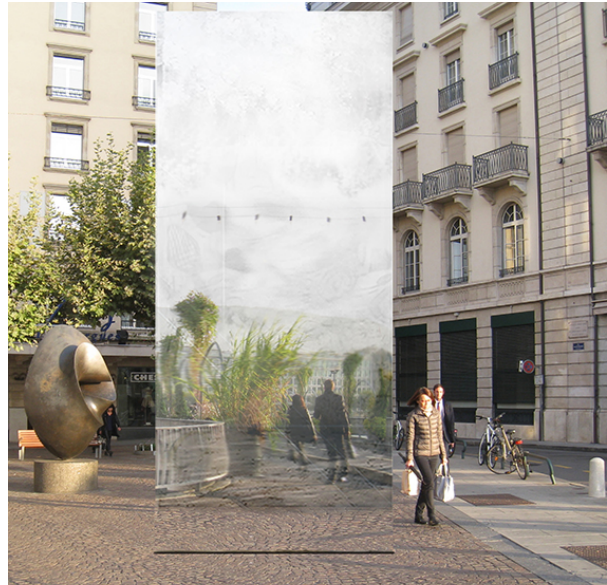
Les 25 bornes-miroir installées sur tout le territoire du Grand Genève invitent le passant à la réflexion. © HES-SO Genève

de Nyon à Thonon-les-Bains, 25 bornes-miroirs géantes de 6 mètres de haut, recouvertes de métal poli sur leurs quatre faces, matérialisent le territoire du Grand Genève. Elles offrent un regard différent sur notre cadre de vie et nos perspectives communes. En plein cœur de la ville, 17 d'entre elles forment une promenade urbaine au fil de l'eau, de la Jonction jusqu'au Jet d'eau. L'ensemble constitue un parcours à la fois ludique, artistique et informatif, qui invite passants et visiteurs à une réflexion sur le thème «Frontières et urbanité».